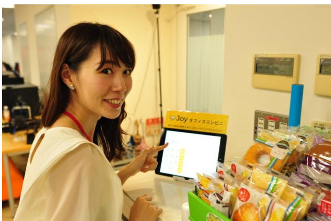
オフィスコンビニなどで簡単に利用できます。