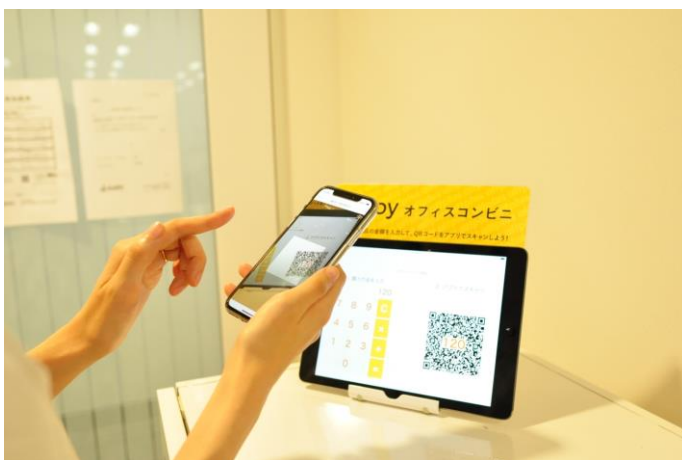
付与された「社内仮想通貨」は、QRコードや専用タブレットを用いて利用